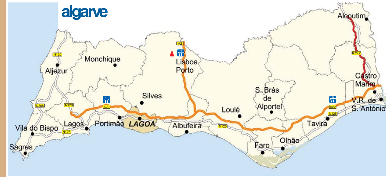
Concelho / Municipio / Canton / Municipality / Bezirk